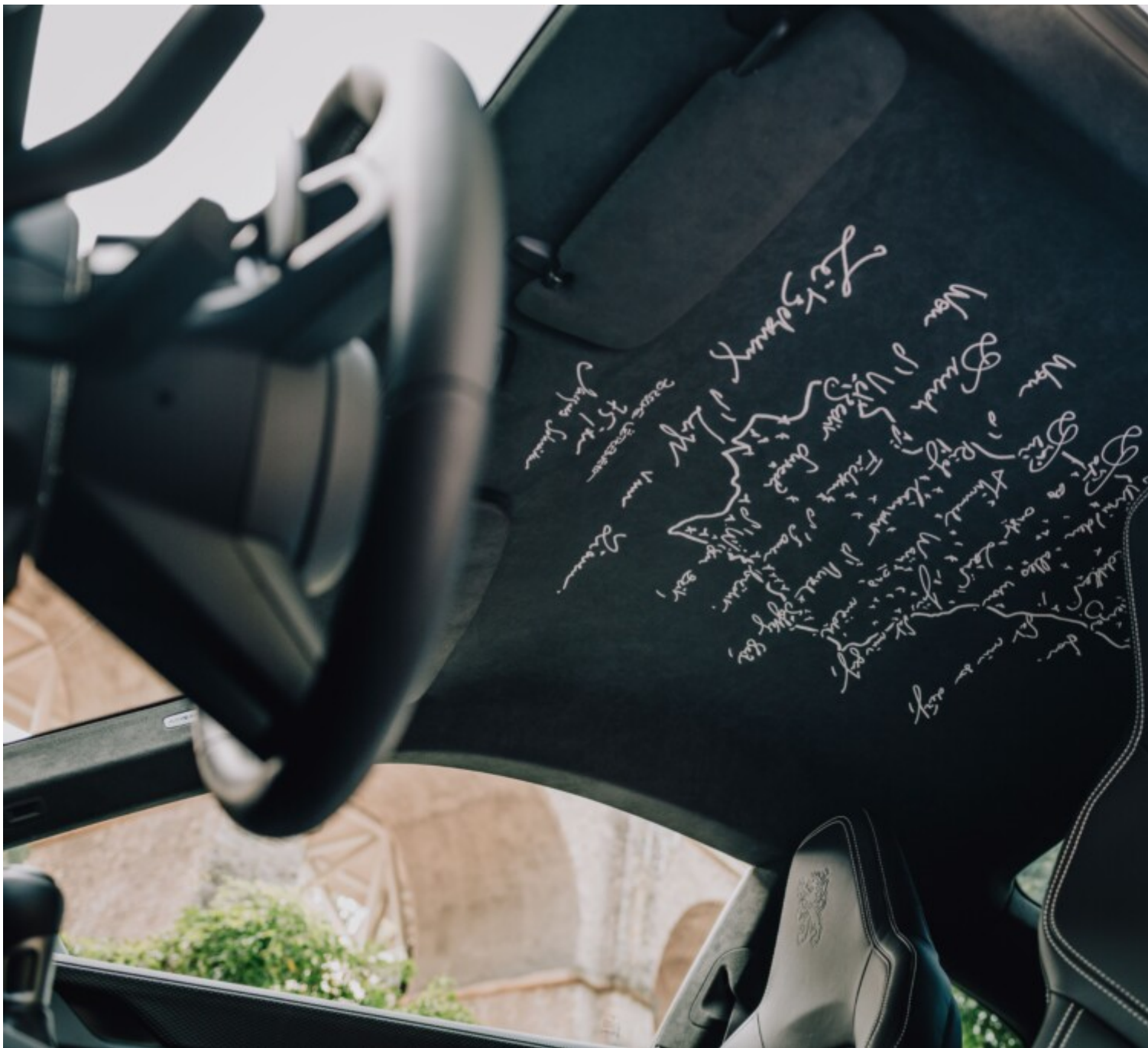
Un hymne au Luxembourg...

La symbolique est forte, aussi, s'agissant de l'habitacle intérieur. Au premier abord tout en sobriété, « ce qui caractérise le besoin de préserver notre sphère privée », il collectionne les éléments surprenants : une carte du Luxembourg, où sont inscrits les premiers vers de l'hymne national, habille le toit (« une option jamais réalisée sur une Porsche ») ; des lions (encore eux), emblèmes du pays, recouvrent les sièges réalisés dans un cuir haut de gamme ; le mot VIVE, « fil rouge du design » est imprimé à divers endroits de la voiture... « Il y a encore plein d'autres détails à découvrir », confie Tom Weber.